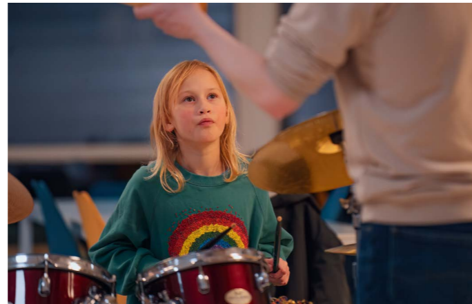
Jazza Brass