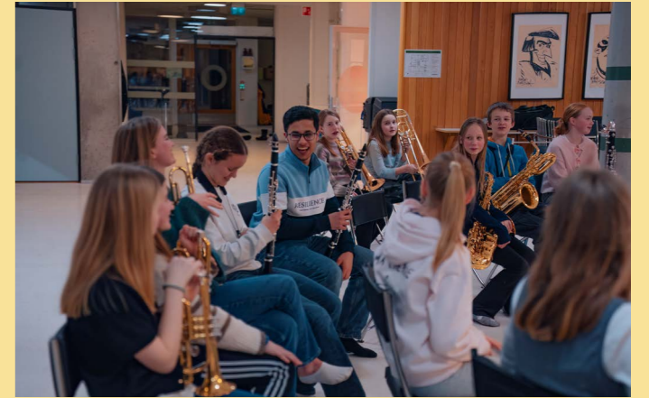
Jazza Brass