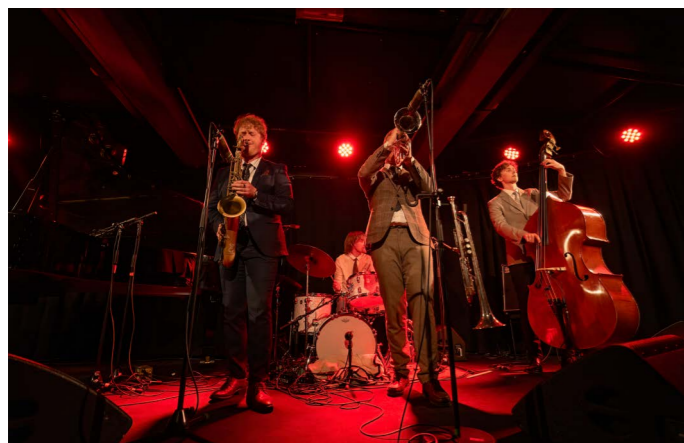
Nutshell, Lyder Røed Quintet

Nutshell har en sterk posisjon internasjonalt og regnes som en av de sentrale showcase-festivalene i Europa, som mange viser til og bruker som inspirasjon for egne opplegg. Det unike ved Nutshell handler om kombinasjonen høy kvalitet, mange konserter, Nattjazz, et variert konsertprogram, en fantastisk natur, og spektakulære konsertarenaer på nøye utvalgte steder i Bergen og omegn. Og, ikke minst en uformell og inkluderende atmosfære som danner et veldig godt grunnlag for nettverksetablering. Nutshell virker i henhold til intensjonene, noe som gjør at vi til nå har valgt å bruke en god del av egne driftsmidler på tiltaket. Vi sliter imidlertid med å holde tritt med den generelle kostnadsøkningen, og vil ha problemer med å videreføre tiltaket etter dagens modell uten styrket økonomi. Vi er helt avhengige av, og takknemlige for, støtte fra Bergen kommune, reisetilskudd fra norske ambassader, og ikke minst støtte fra Music Norway sitt delegatprogram, for å kunne gjennomføre.