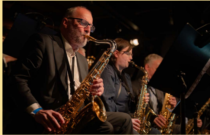
Bergen Big Band - Big Band Boom