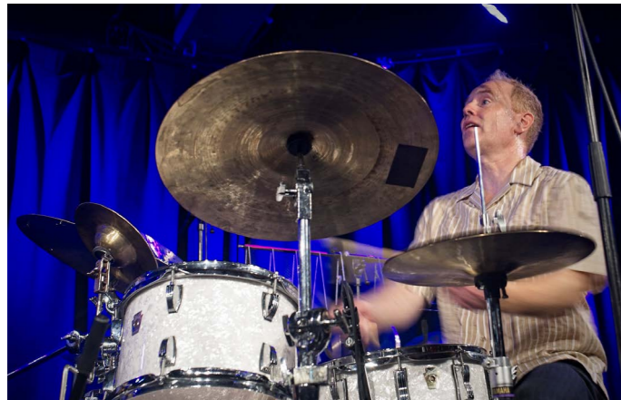
Hovedscenen Bergen

https://bergenjazzforum.no/om-bergen-jazzforum/historikk/