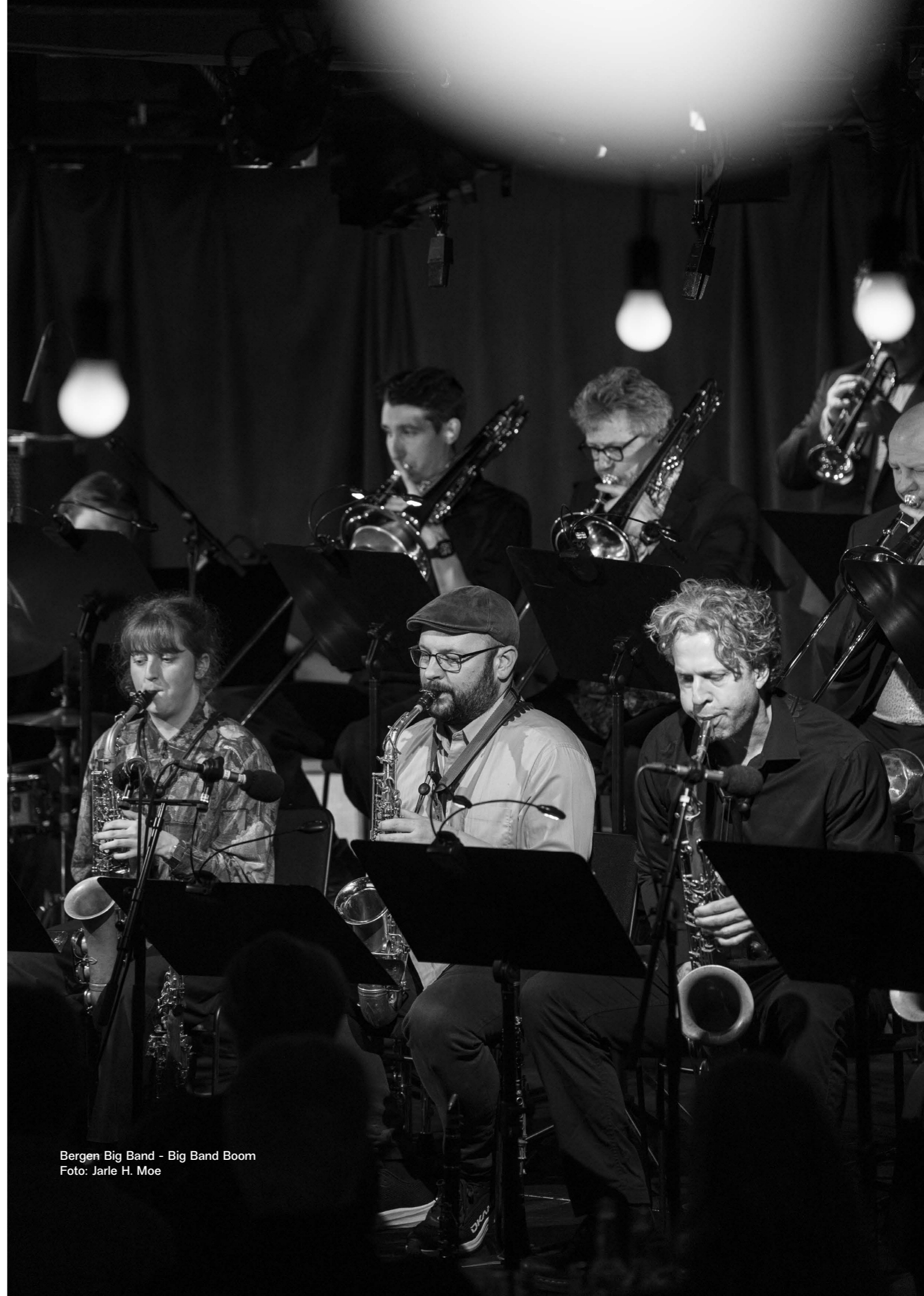
Bergen Big Band - Big Band Boom