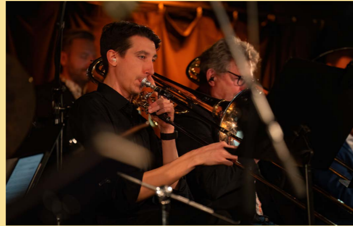
Bergen Big Band - Big Band Boom