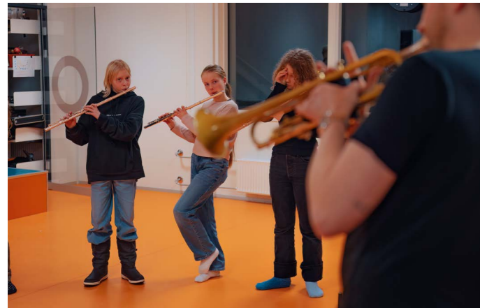
Jazza Brass

Samlet besøkstall (betalende/ikke-betalende) for de 22 Stamvegkonserterne i 2025 var 827, som er 400 lavere enn året før. Et snittbesøk på 38 pr konsert er også noe lavere enn i fjor. En årsak til dette er at vi ikke hadde noen turnéer rettet mot barn som publikum. Vi vil bidra der vi kan for å prøve og oppnå bedre konsertbesøk, og har etter ønske fra arrangørene besluttet å styrke innsatsen knyttet til markedsføring. Vi vil lage pakker for hver enkelt turné som arrangørene kan bruke lokalt. Som følge av et uttrykt ønske fra arrangørfeltet om flere Stamvegturnéer legger vi opp til å øke antallet fra høst 2026, og vi planlegger et utvidet tilbud med 8 turnéer for 2027 – som en del av markeringen av vårt 30-årsjubileum.