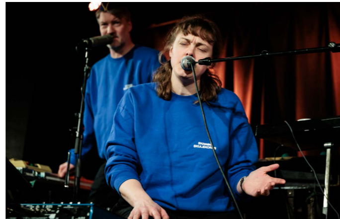
Hovedscenen Bergen