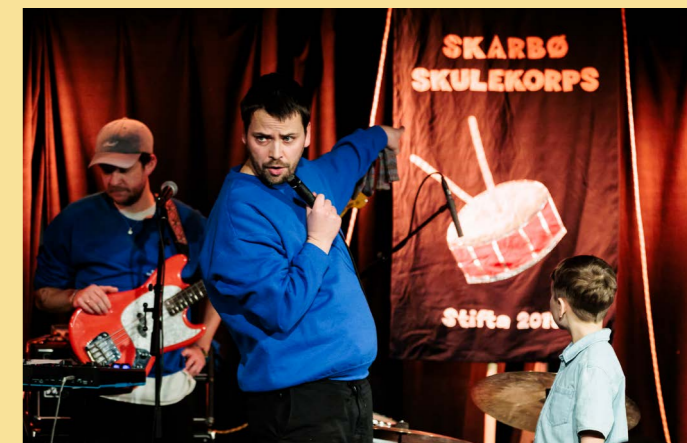
Skarbø Skulekorps

Vi har et nært og tett samarbeid med Regionscenen Stavanger jazzforum omkring konserter, talentutvikling og andre prosjekter, og vi initierer tidvis nye konsertproduksjoner for barn. Vi har et stort internasjonalt kontaktnett og engasjement , og er aktivt medlem i Europe Jazz Network (EJN) .