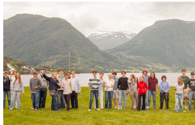
Sommerjazzkurs 2025