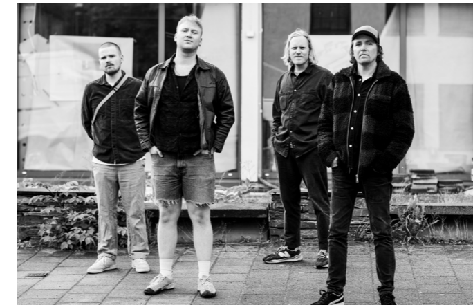
The Red Barn

I alt 22 konserter, med i alt 20 musikere. Musikerne honoreres i tråd med Creos anbefalte satser.