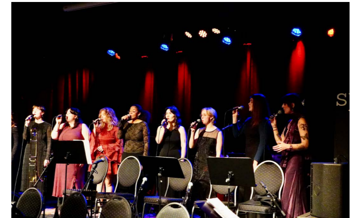
Regionscenen Stavanger