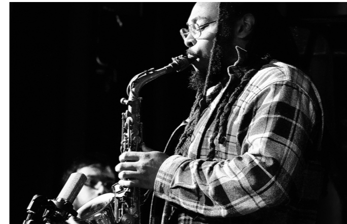
Regionscenen Stavanger

Stavanger jazzforum er en nær og viktig samarbeidspartner for små og store konsertprosjekter, talent-utviklingstiltak (Jazz i Sikte), samlinger/møter og andre aktiviteter.