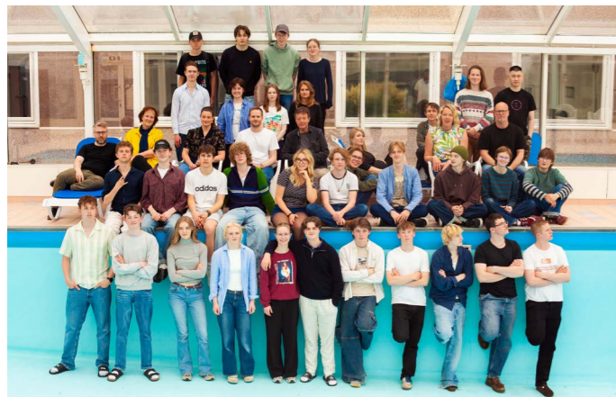
Sommerjazzkurs 2025

Kursvirksomheten vår har som formål å vekke interesse, stimulere og rekruttere gjennom å gi særlig musikkinteressert ungdom en innføring i jazz og improvisasjon som metode og form; at de skal få et forhold til sjangeren, og få kjennskap til videre utdanningsmuligheter. Vi har alltid med instruktører med nær kobling til jazzutdanningene ved UiB og UiS, som kan veilede og informere om muligheter. Det er veldig gledelig å se at mange Sommerjazzkursdeltakere kommer tilbake år etter år, og at flere søker seg videre til jazz-/musikkutdanning.