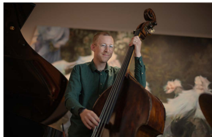
Nutshell, Vinterhagen

7 showcasekonserter ble presentert, og i alt 32 musikere medvirket: