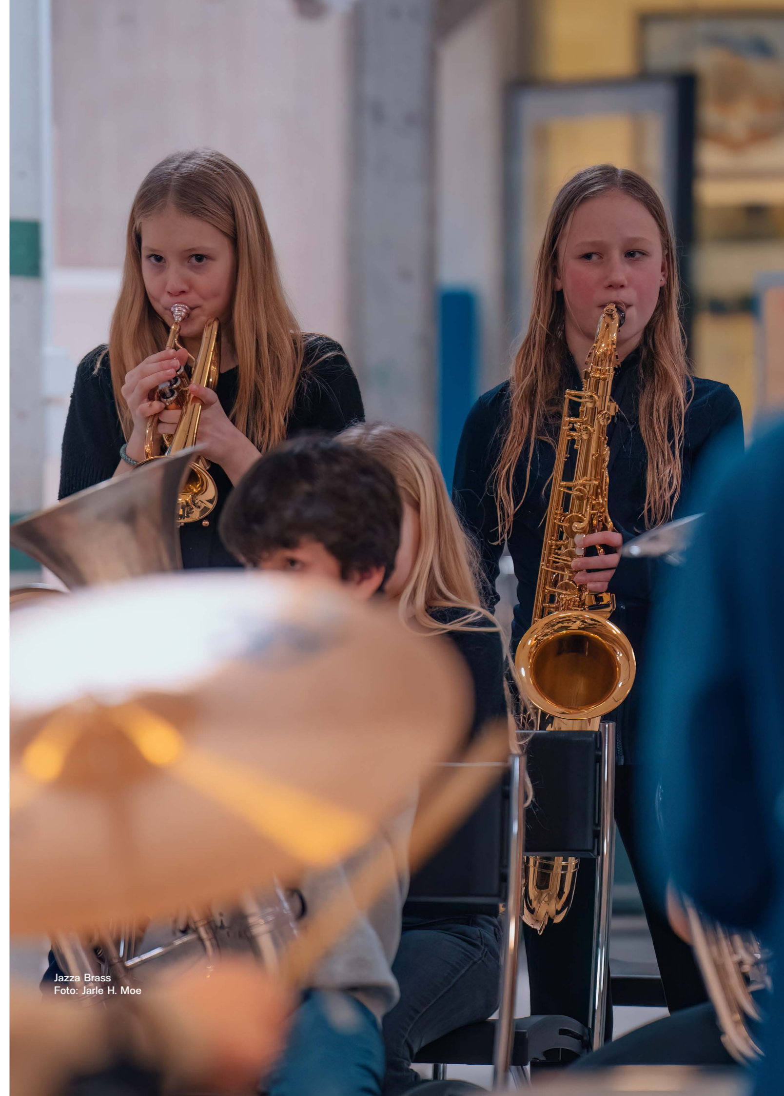
Jazza Brass

All innsats på dette feltet gjøres i samarbeid med frivillige klubber, festivaler, utdanningsinstitusjoner og andre ressurser i regionen.