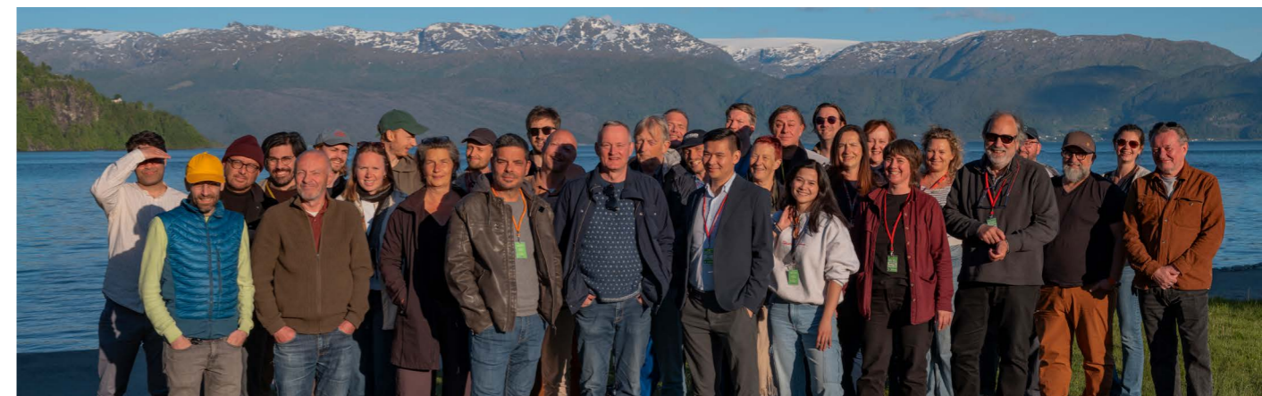
Nutshell