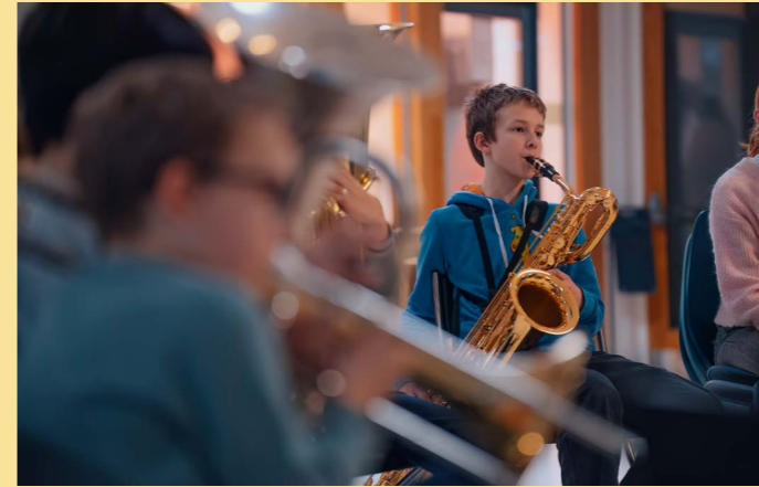
Jazza Brass