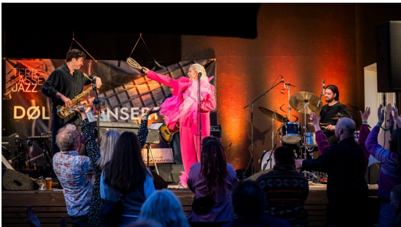
Noen lon på Terrassejazz 2024

Sør-Norge er en aktiv festivalregion med ni jazzfestivaler. Jazzfestivalene skaper viktige årlige høydepunkter i hele regionen, og festivalene og klubbene i regionen utfyller hverandre på en god måte. De fleste festivalene drives i all hovedsak av frivillige og presenterer mye jazz av høy kunstnerisk kvalitet.