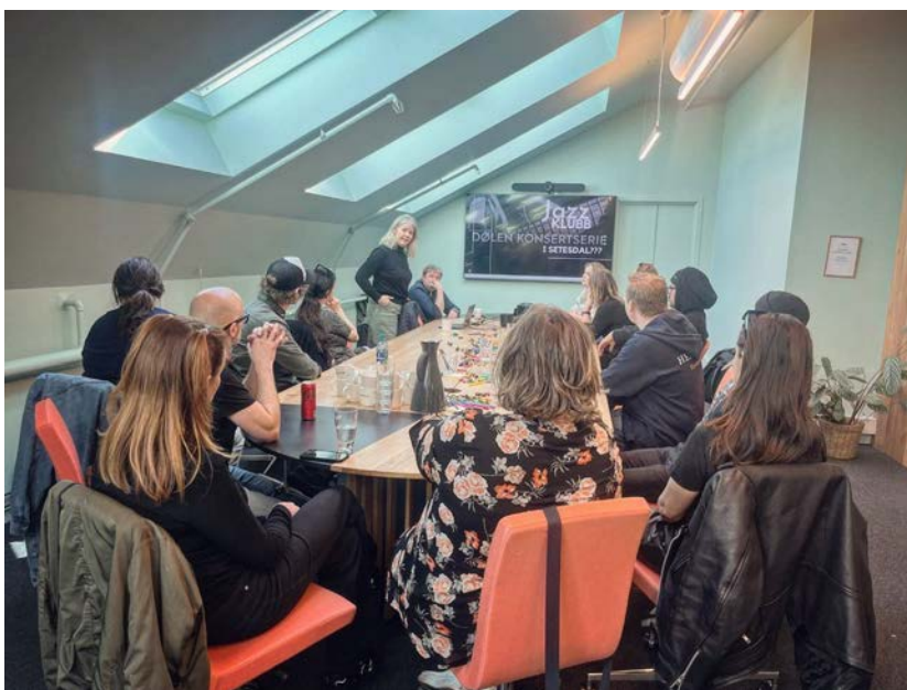
Arrangørmøte våren 2024: Dølen konsertserie deler sin «best practice»

Sørnorsk jazzsenter veileder musikere, klubber, storband, klubber og festivaler pr. telefon, mail og lignende gjennom hele året. Dette kan handle om ting slik som at noen ønsker å etablere en ny jazzklubb, arrangører eller musikere fra egen eller andre regioner som ønsker informasjon om spillesteder i vår region, eller en musiker som trenger hjelp og veiledning med søknad på et prosjekt. I tillegg har vi åpne møter om diverse temaer.