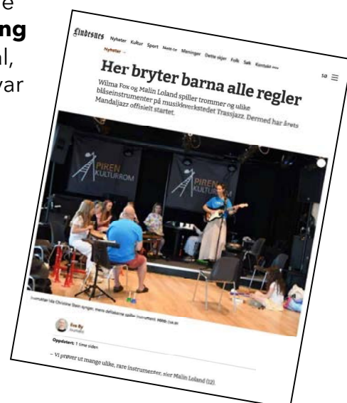
Artikkel fra Lindesnes avis

Styret har besluttet å gjøre Trassjazz til en fast aktivitet fra 2025. Vi har også blitt oppfordret til å søke støtte fra Kreativt Europa for å utvikle prosjektet i et europeisk samarbeid, og planlegger å søke om støtte til prosjektet Despite Jazz , som vil involvere partnere fra Ukraina, Polen, Latvia og Danmark.