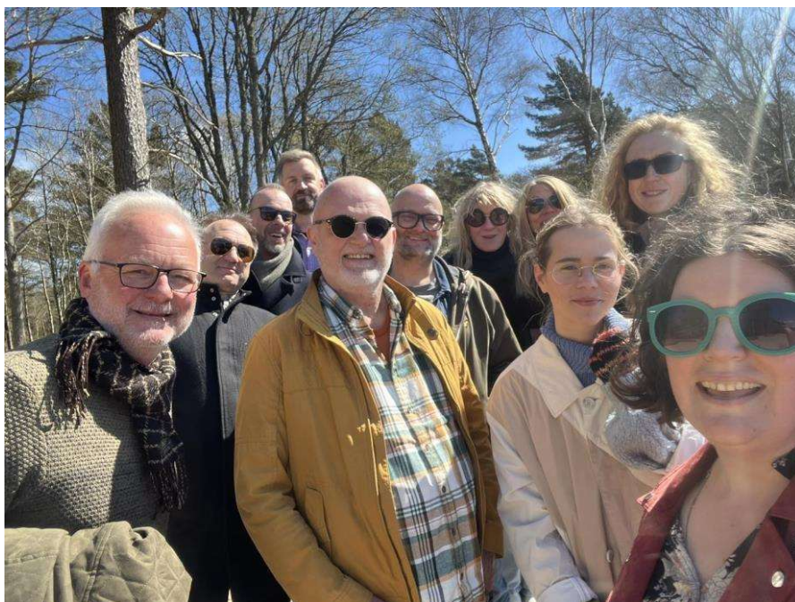
Styret og administrasjonen i Sørnorsk jazzsenter 2024-25