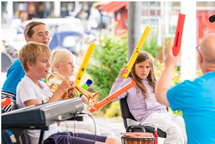
Trassjazz på Canal Street

- Barnejazz-verksteder for barn og unge fra 7-15 år