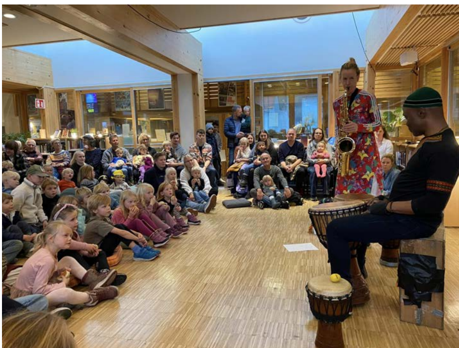
Musikk-o-rama hos Risør jazzklubb