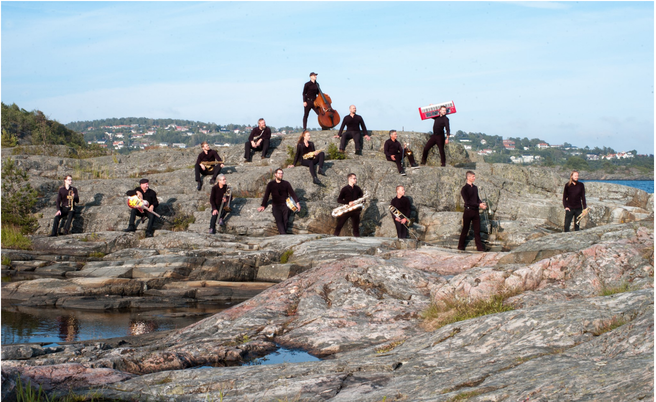
Christianssand Storband

Sørnorsk jazzsenter har 15 storband i regionen som er medlem i Norsk jazzforum. De 263 frivillige i storbandene utgjør vår største frivilligruppe . Hvert storband består av 12-21 medlemmer, og de fleste har ukentlige øvelser gjennom året. Høydepunktene inkluderer konsertene, men de ukentlige øvelsene fungerer også som viktige sosiale møteplasser . Mange storband arrangerer også turer og andre sosiale aktiviteter.