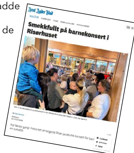
Artikkel fra Aust-Agder blad

Vi ser det som en viktig oppgave for jazzsenteret å hjelpe klubbene i regionen å utvikle sin programmering. Flere av klubbene hadde aldri hatt barnekoncert før og vi fikk tilbakemeldinger på at klubber fikk prøvd ut nye konsertsteder , som biblioteker, at de har nådd nye publikumsgrupper og noen fikk til og med nye sponsorer .