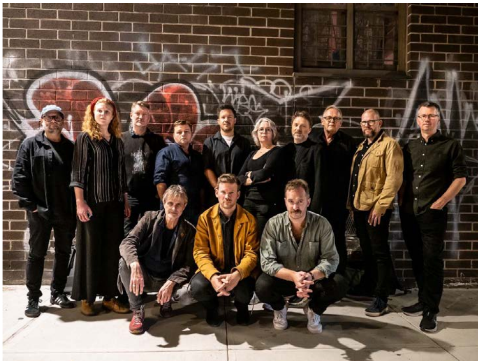
Scheen jazzorkester på USA-turné

- Sørnorsk-regionens store profesjonelle jazzensemble