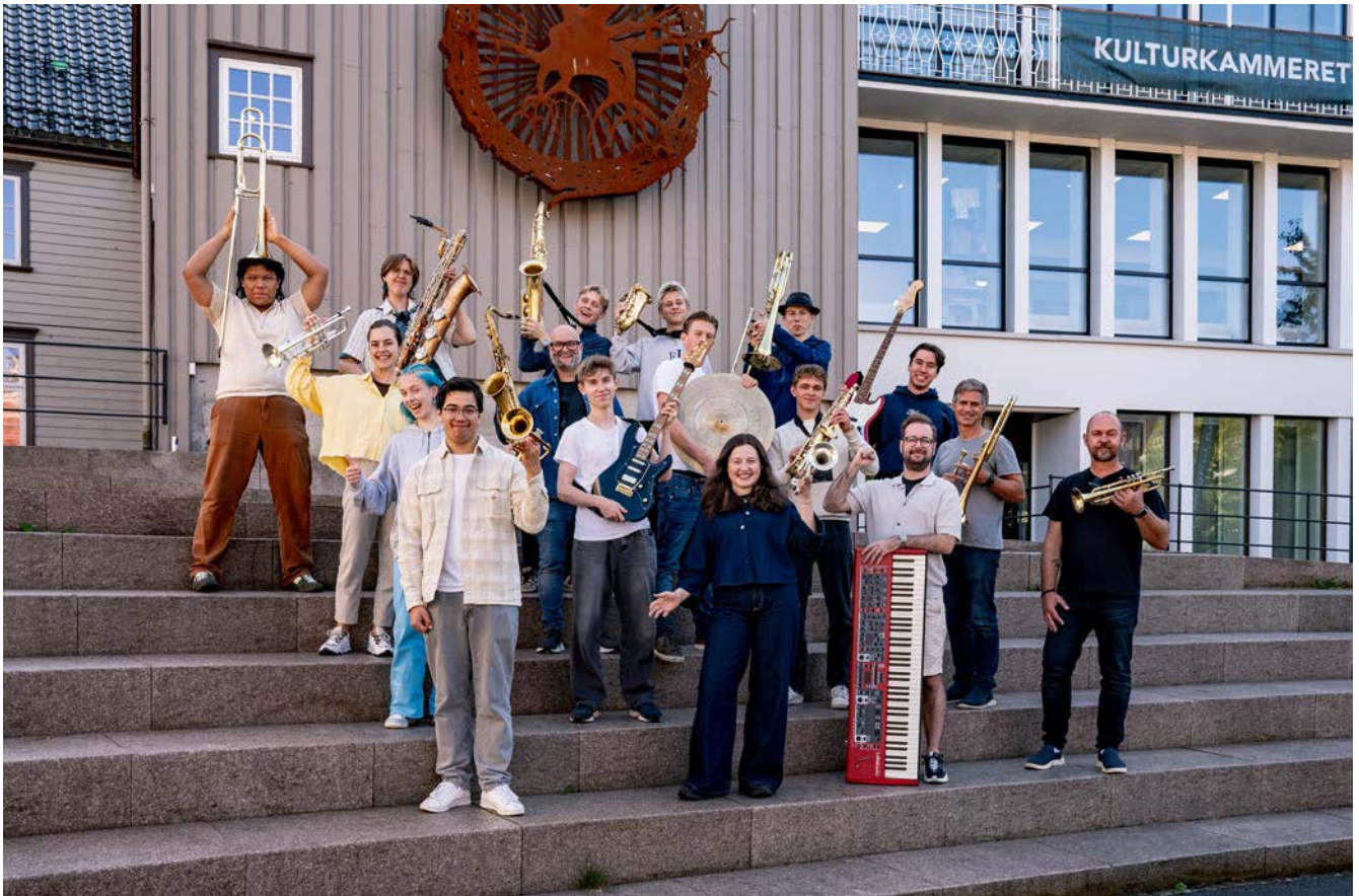
Sørnorsk ungdomsstorbands besetning 2024-25

Sørnorsk ungdomsstorband (SNUS) er et tilbud til ungdommer fra 15-20 år som ønsker å lære å spille jazz. SNUS består av ungdommer fra både Agder, Vestfold og Telemark og er en viktig arena for ungdommene å knytte nettverk på tvers av kommune- og fylkesgrenser.