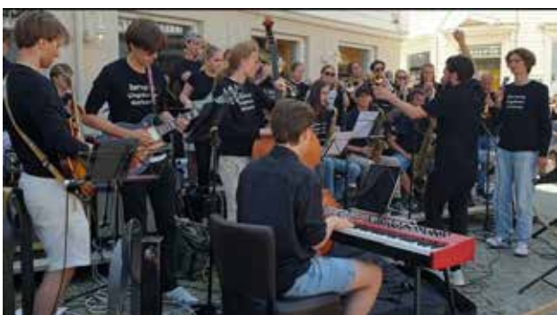
Konsert SNUS og BUJO Mandaljazz 02.07.

Lørdag 02. juli spilte SNUS og BUJO en felles utekonsert i Hestetra i Mandal sentrum som del av Mandaljazz-festivalen. I forkant av konserten hadde bandene jazzparade som var en del av markeringen av Mandal bys 100-års jubileum denne dagen. Mye folk, stor stemning og stor begeistring – en flott avslutning for 2021-2022-utgaven av bandet.