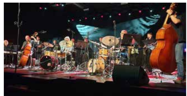
Scheen Jazzorkester & Cortex: Konsert Skiensjazzdraget 10.11.22