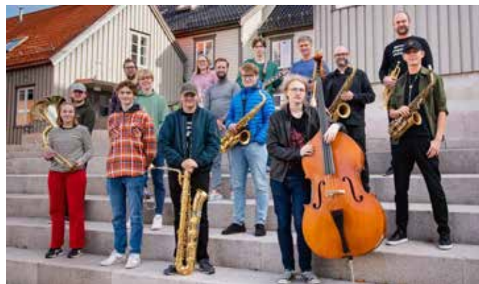
Sørnorsk Ungdomsstorband 2021 - 2022

høsten 2022. Prøvespillet ble gjennomført online og ved innsending av lydfiler.