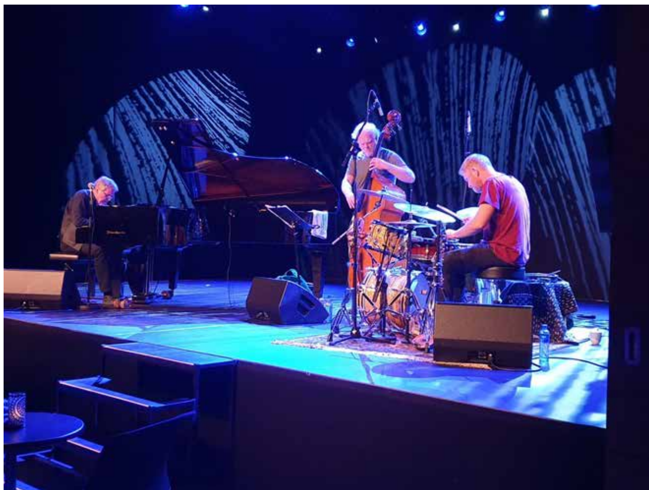
Bobo Stenson Trio på Sørnorsk-turné: Konsert Skiensjazzdraget 31.03.22