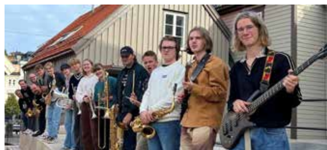
Sørnorsk Ungdomsstorband 2022 – 2023

Både 2021/2022 og 2022/2023-utgaven av Sørnorsk Ungdomsstorband har bestått av / består av ungdom fra begge fylkene i regionen.